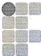
Francisco Nairton do Nascimento Reitor do Instituto Federal do Tocantins

Art. 8º Revogam-se as disposições em contrário.