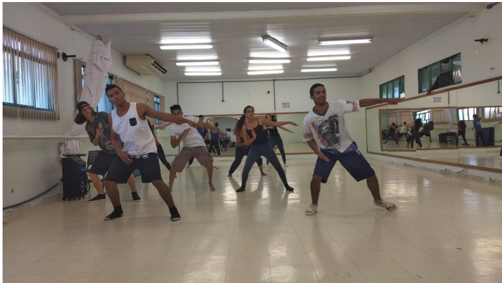
Figura 3- Ensaio Interventores

em Teatro, usa de seu aprendizado para passar para aos participantes questões do universo cênico que envolve dança e teatro na perspectiva da valorização do “eu”, da socialização, da ocupação de espaço e interação entre pessoas da cidade de Gurupi/TO e região.